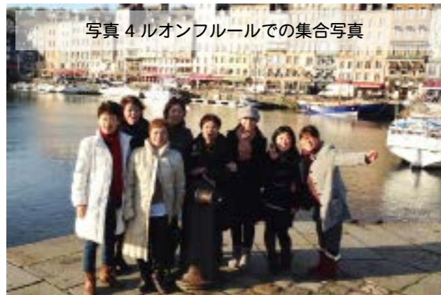
写真4 ルオンフルールでの集合写真

の移動合計1000kmという内容でした。フランスの運転手さんの腕なのか？ベンツの大型バスという車種のためなのか？覚悟をしていたバス移動での疲れはありませんでした。添乗員さんの「フランスの労働組合の中で最強の運輸労組」という乗車日、最初の説明が終日、快適な旅となったように思う。(文責：藤原)