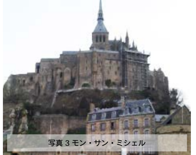
写真3 モン・サン・ミッシェル