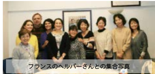
フランスのヘルパーさんとの集合写真

ヘルパーさんとの懇談内容の詳細は、報告会2月15日（土）の夕方からの報告会でしますので、こちらにおいて下さい。