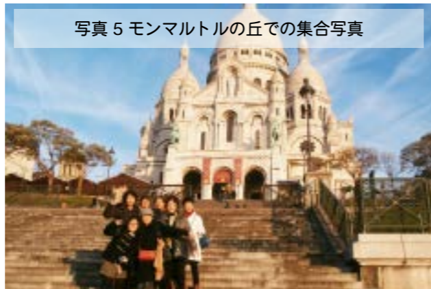
写真5 モンマルトルの丘での集合写真