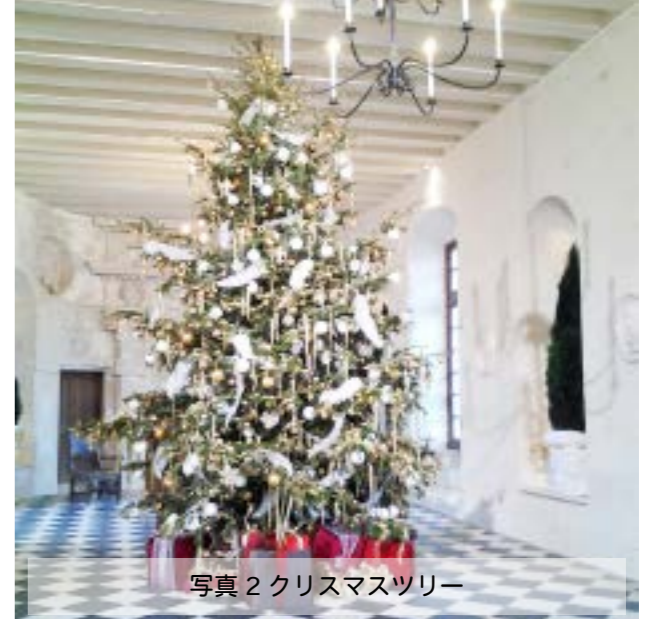
写真2 クリスマスツリー