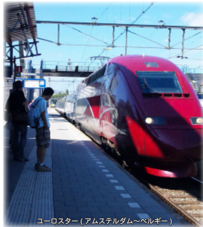
ユーロスター(アムステルダム～ベルギー)

イギリス国内の移動にはフリーチケットを日本から購入しました。イギリスは鉄道王国です。日本のとり鉄ファンならきっと一度は行ってみたい国でしょう。実際はNPO等を中心に鉄道保存をしている関係もあり、とにかく運賃が「高い」のでフリーチケット3万円を買っても2回乗れば、元が取れます。オランダからロンドンへの帰り道は、以前からあがれていた「タリス+ユーロスター」のチケットを購入しました。こちらは大陸を300Kmで走る日本と言えば新幹線です。東京～大阪位の距離で、オランダ→ベルギー（乗り換え）フランス→（ドーバー海峡をトンネルで抜け）ロンドンに到着してゆくというコースで約3時間30分。チケットは日本から購入でき、こちらは8千円とネットや旅行案内書で調べたものより半額近く安く、おどろきました。円高のおかげだったようです。一度は聞いて、相談してみることを実感しました。相談・購入先は「地球の歩き方」事務所です。