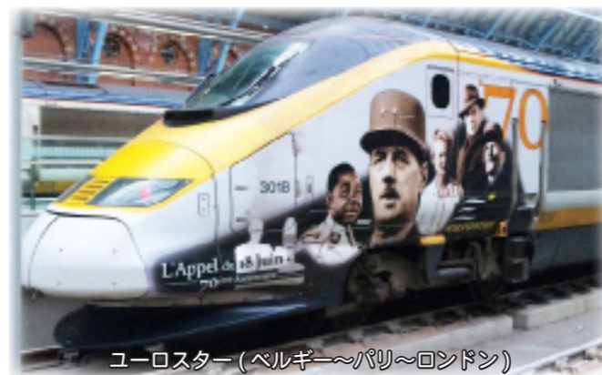
ユーロスター(ベルギー～パリ～ロンドン)

計画の次は宿泊先を選ぶことです。格安の宿泊先はなんとと言っても「ユースホステル」です。会員になるのには2500円かかりますが、イギリスはやや高めでも1泊3500円。