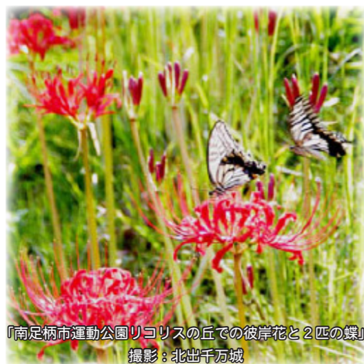
「南足柄市運動公園リコリスの丘での彼岸花と2匹の蝶」

日時：11月21日(日)13:00～ 会場：ラパスホール テーマ：「医療行為を考える」