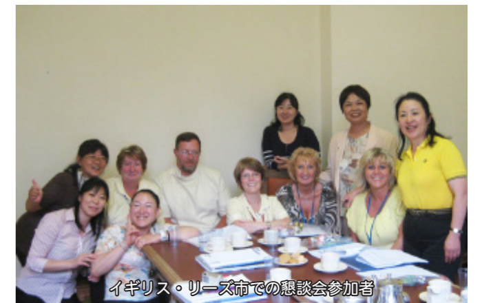
イギリス・リーズ市での懇談会参加者