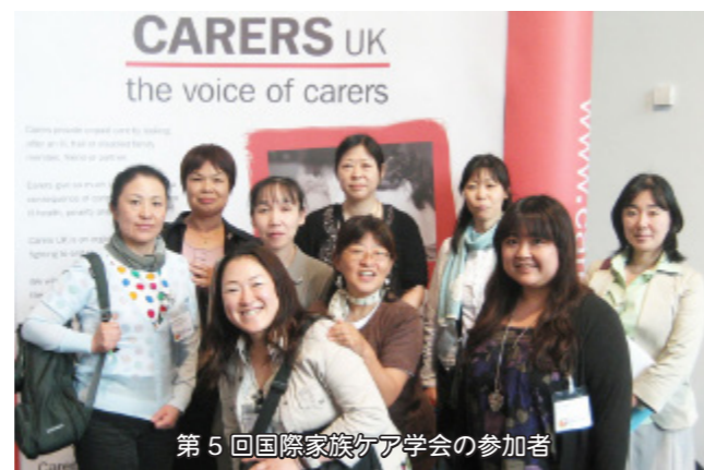
第5回国際家族ケア学会の参加者

しかし、そういった負担をしてでも、会議で話し合われていた内容が日本ではなかなか聞けないものです。インターネットでのアップは7月15日位から始まるということですので、英語のできる方は会議で報告された要約を読み取ることができると思います。