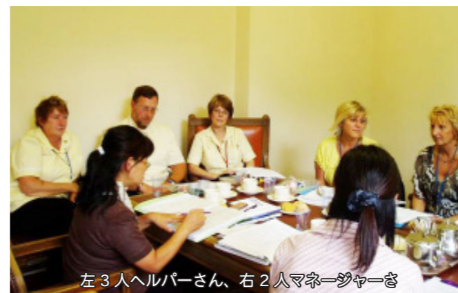
左3人ヘルパーさん、右2人マネージャーさ

まず、1チームは2人となっています。2人は同時に在宅に訪問して仕事をおこなうとのことでした。訪問時間は10分から1時間30分以上になる場合もあるとのことでしたが、事務所との連絡は携帯電話で取りながら仕事を進めているとのことでした。日本のように無理なプランが組まれて、訪問するヘルパーと当事者にしわ寄せ